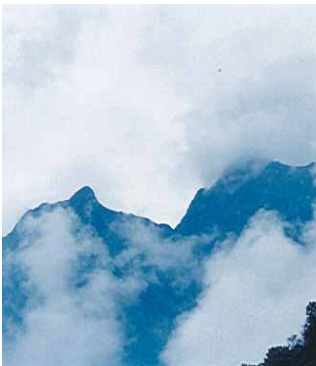
Vista Pico de Loro, Parque Nacional Natural Los Farallones