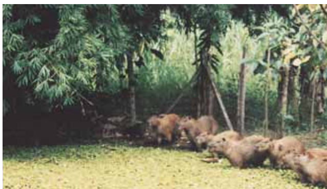
Estación Biológica El Vínculo - Zootría de Chigüiros