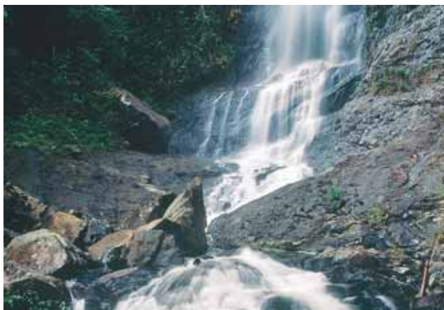
Centro de Educación Ambiental el Topacio