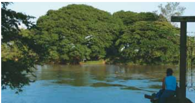
Paso de la Torre

Actividades: Disfrute del paisaje, recorridos náuticos, pesca artesanal.