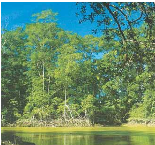
Manglares Río Yurumanguí