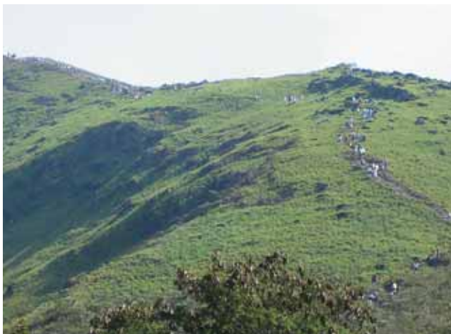
Cerro las Tres Cruces