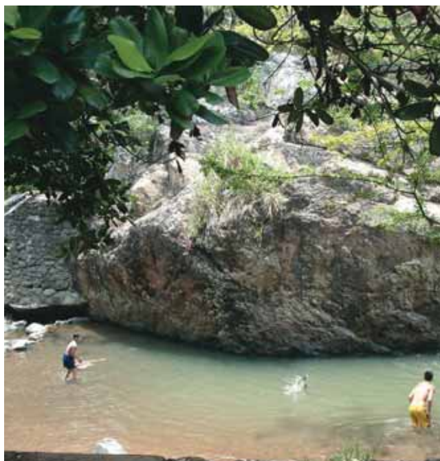
Balneario en el río Cali