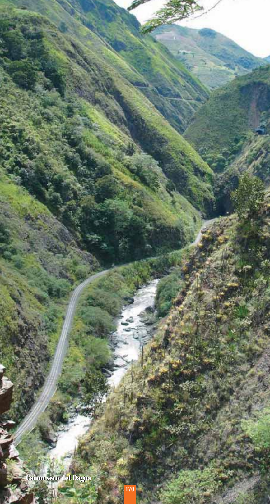
Cañon seco del Dagua