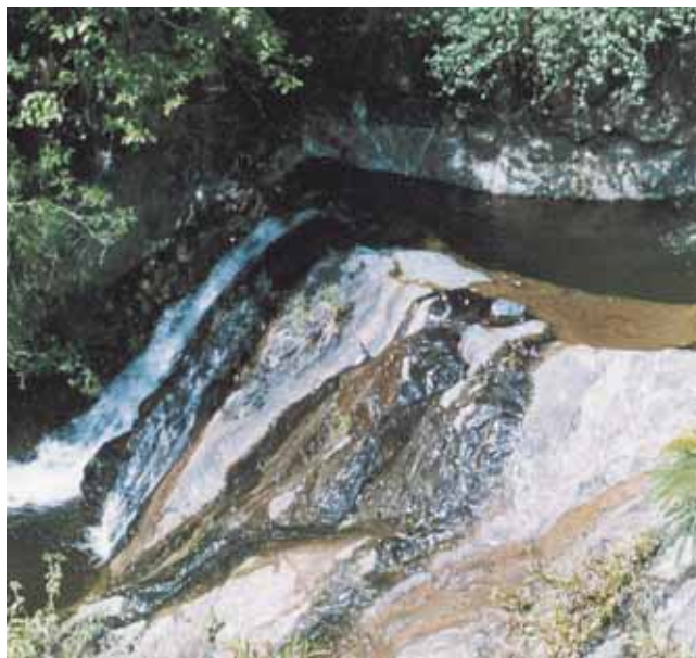
Toboganes del Río Vijes