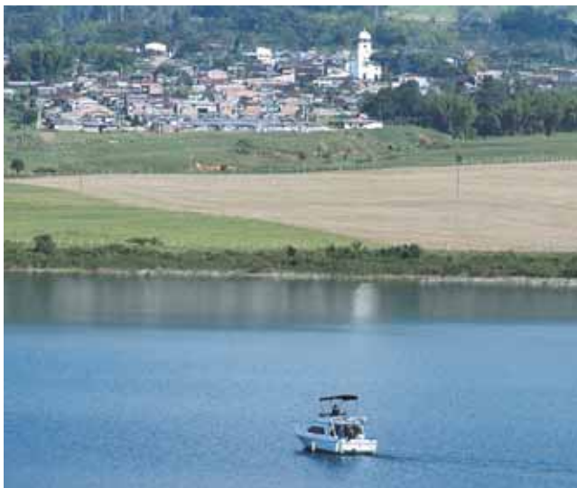
Lago Calima y vista del municipio

Informes: Secretaría de Cultura y Turismo de Calima.