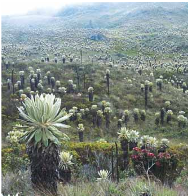
Páramo de Santa Lucía.