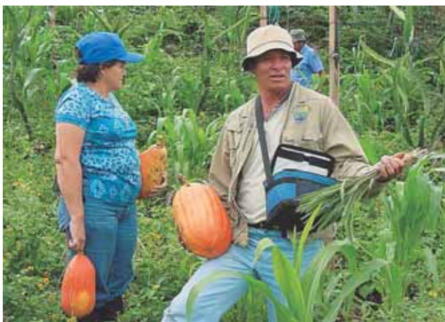
Finca Vista Hermosa

Informes: Fenicia Defensa Natural FEDENA (2) 226 0037.