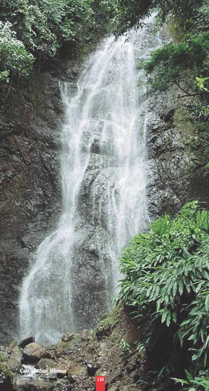
Cascada San Alfonso