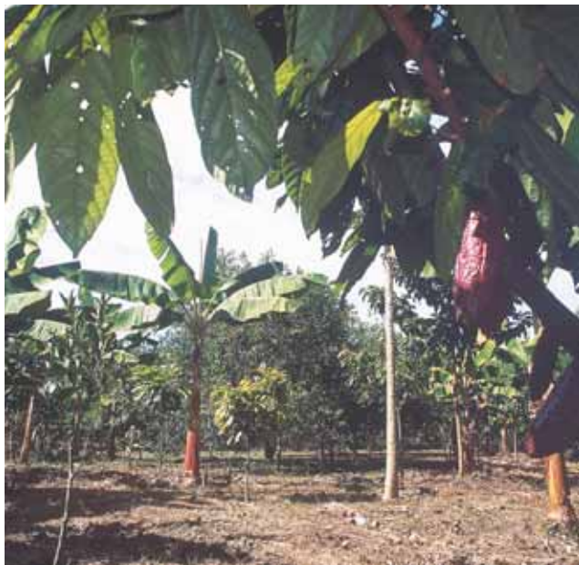
Cultivos en Andalucía