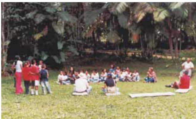
Reserva Natural Casa de la Vida