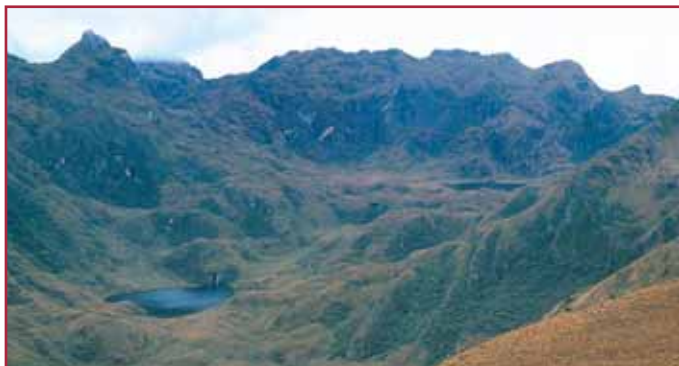
Laguna Natural en el parque Las Hermosas

Informes: (2)654 3719 - 654 3720 Dirección Territorial Suroccidente Unidad de Parques Nacionales Naturales.