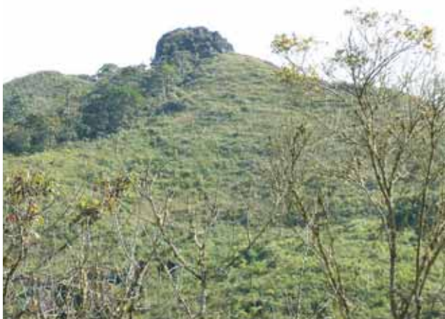
Cerro Dopo La Albania