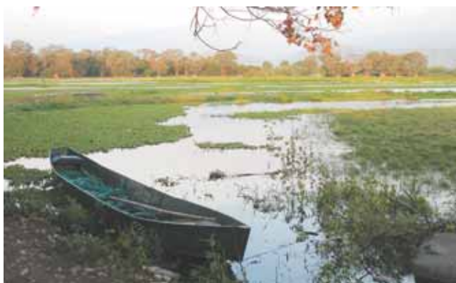
Laguna de Sonso