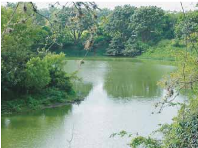
Madrevieja Román Gota e'Leche

Informes: CVC - Buga (2) 228 1922 - 227 8347.