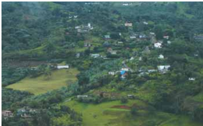
Corregimiento La Elvira

Se encuentra ubicado al norte del municipio de Santiago de Cali, sobre la Cordillera Occidental en la parte superior de la cuenca del río Aguacatal. Su extensión es de 1.607.08 hectáreas y su población de 2.027 Habitantes, cuenta con la red de fincas agroecoturísticas donde se puede disfrutar de senderos, cascadas, lagos de pesca y observación de aves. Su temperatura promedio de 17°C.