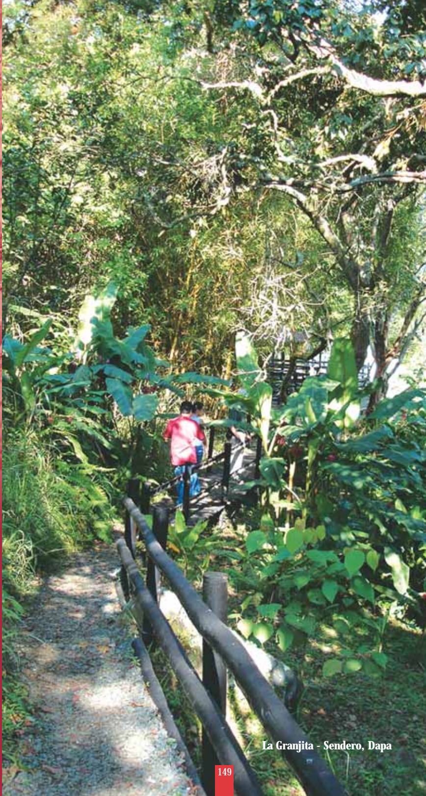
La Granjita - Sendero, Dapa