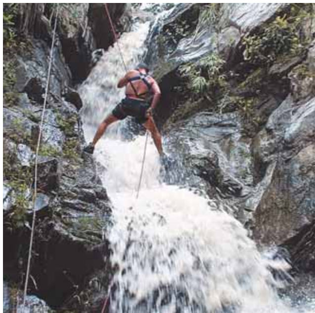
Rappel en la cascada La Arenosa