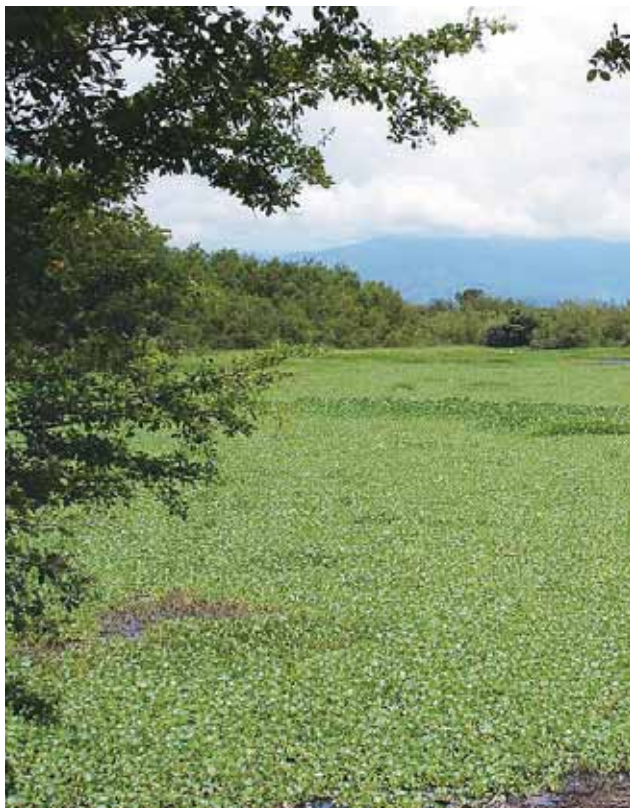
Madrevieja el Cocal