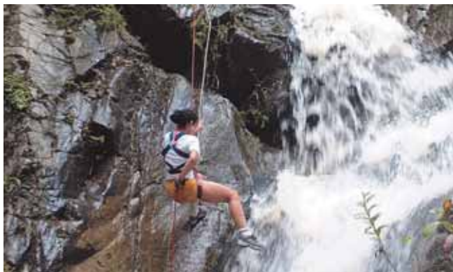
Descenso Cascada La Arenosa