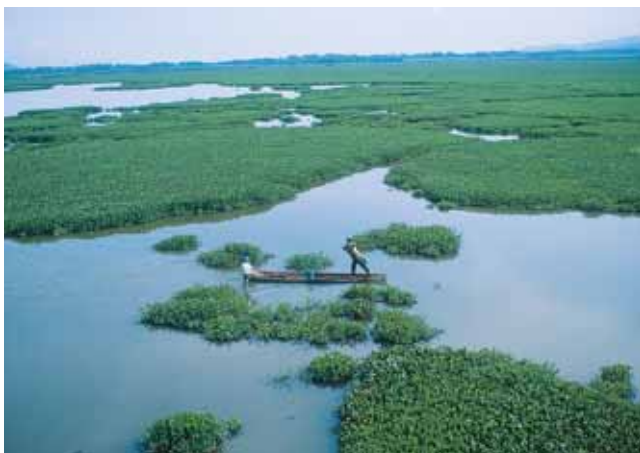
Laguna de Sonso