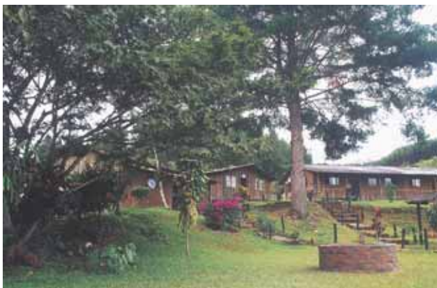
ITAF Calima Darién