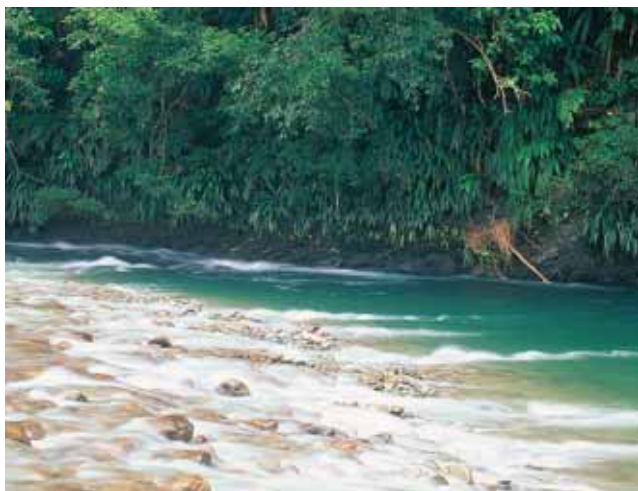
Río Agua Clara