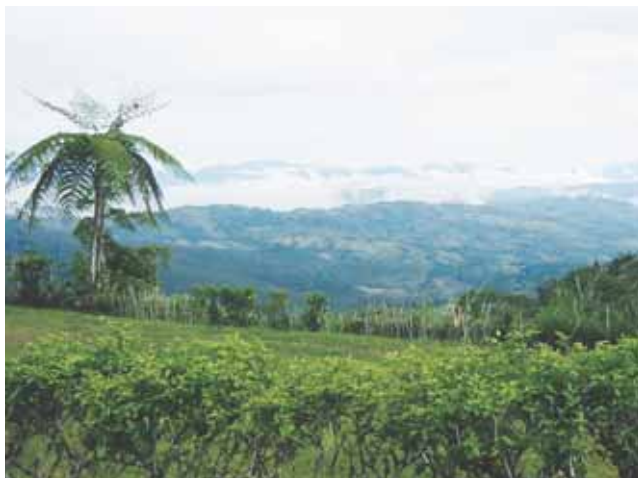
Reserva Natural de la Sociedad Civil Loma Linda