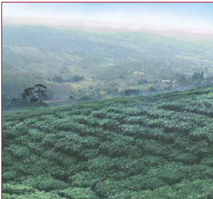
Cultivos de té en Bitaco

Teléfono: 513 35 09 lucienneagua@hotmail.com