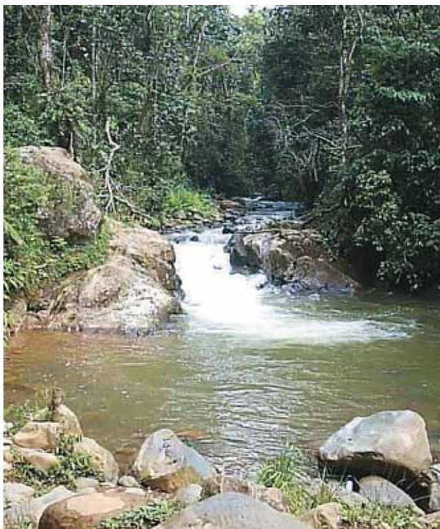
Río Meléndez - charco El Chispero