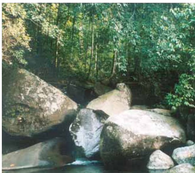
Quebrada Chontaduro - Vereda Peón