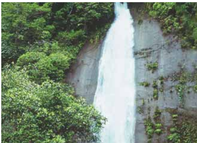
Cascada en Bahía Málaga