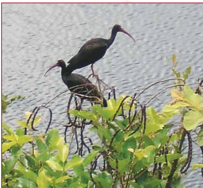
Ibis Negro en la Madrevieja

Informes: (2) 2205119 - 2205196 - 2205100.