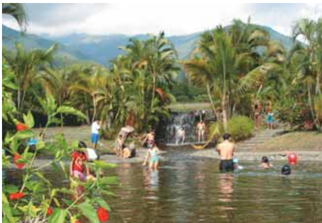
Hostal del Piedemonte - Hacienda el Paraíso