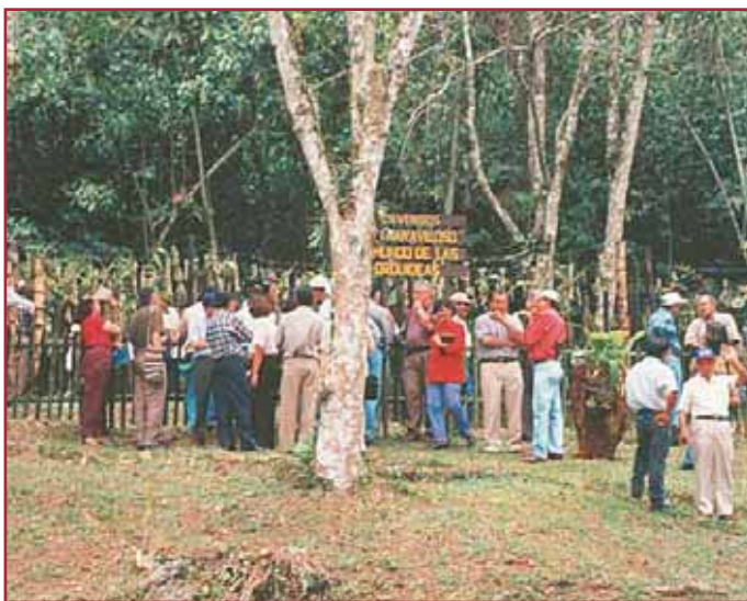
Capacitación en el Bosque de Yotoco

Actividades: Observación de fauna, recorrido por senderos ecológicos, reconocimiento de especies vegetales, visita a áreas de producción de alimentos, senderismo.