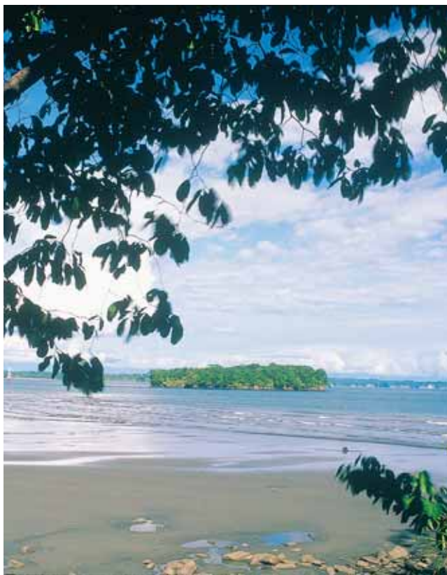
Juanchaco - Buenaventura

Informes Muelle Turístico (2) 241 9120, CVC Buenaventura (2) 242 3862.