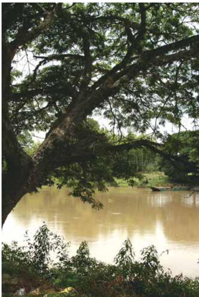
Paso de La Barca - Río Cauca