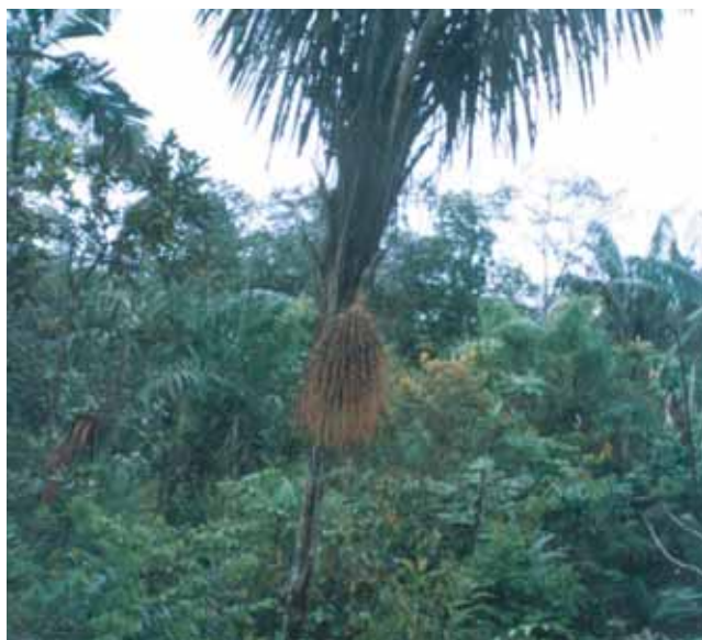
Bosuque La Bendición de Dios