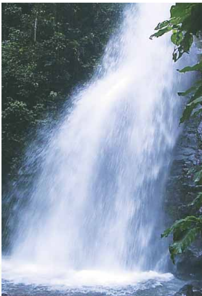
Cascada de los Alemanes - Vereda Candelaria- Corregimiento de Villacarmelo

Su área estimada es de 33.11 Kilómetros cuadrados y lo componen sus veredas Dosquebradas, Candelaria, Villacarmelo (cabecera), El Carmen – El Minuto, La Fonda y Alto Mangos. Lo circunda el río Meléndez, el cual ofrece grandes atractivos a lo largo de su cauce y en su paso por este corregimiento entre ellas encontramos: Los Charcos de la Bocatoma, El Chispero, El Guarapo; hermosas cascadas en Dosquebradas y La Candelaria, así como la exuberancia del bosque andino por estar ubicado en zona del Parque Nacional Natural Farallones y de Reserva Forestal de Meléndez permiten el disfrute de las aguas cristalinas del Río Meléndez y la observación de diferentes especies de flora y fauna y miradores de amplia panorámica hacia el sur de Cali.