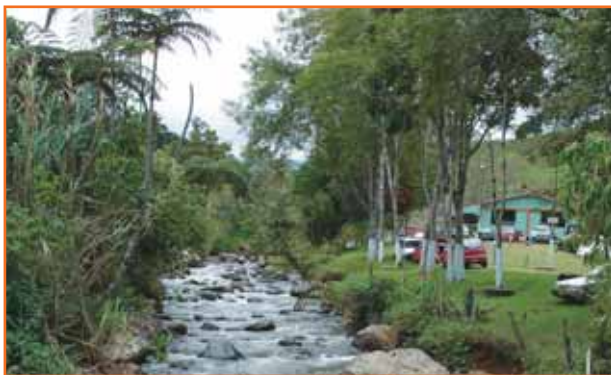
El Queremal, río San Juan

Actividades: Balnearios naturales, disfrute del paisaje, práctica de deportes.