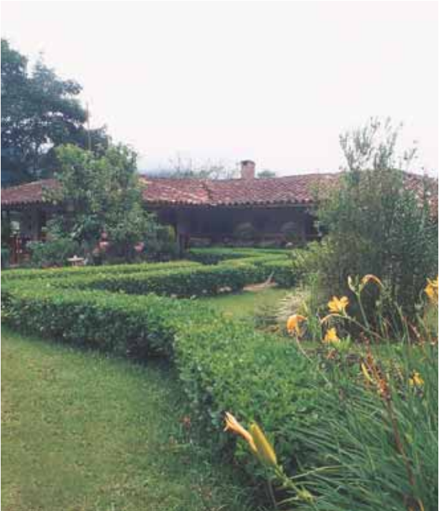
Entre Pájaros y Flores