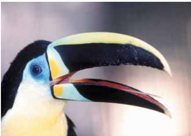
Tucán, Zoológico de Cali