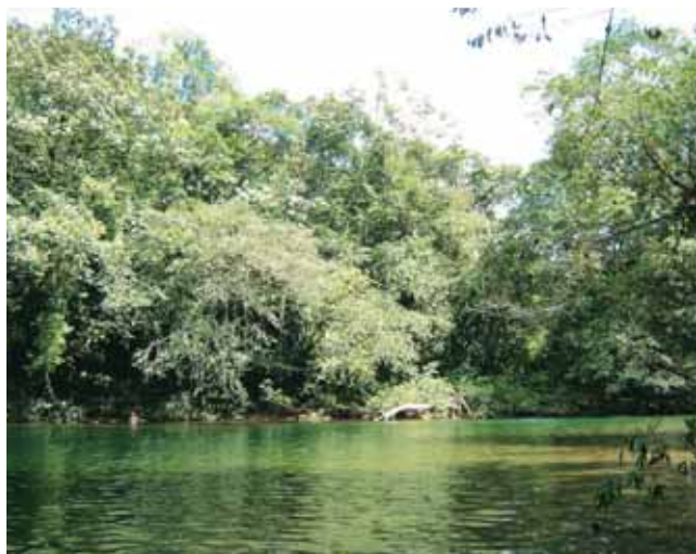
Río San Cipriano