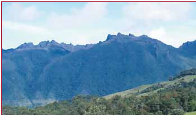
Picos de Japón