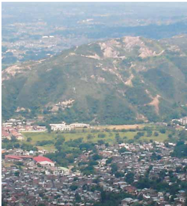
Cerro La Bandera