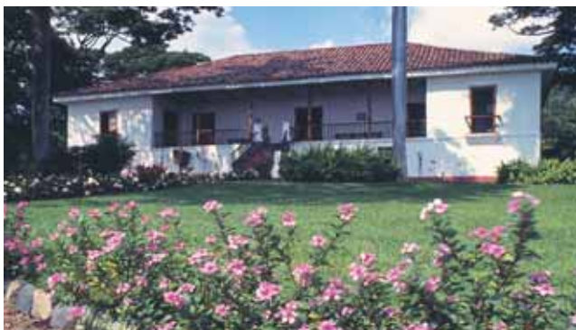
Hacienda El Paraíso

Informes: (2) 2562378 (2) 5566170 – 5583466 - 5583477 / inciva@telesat.com.co