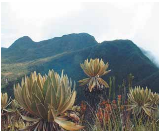
Cerro Calima - Parque Regional Natural del Duende