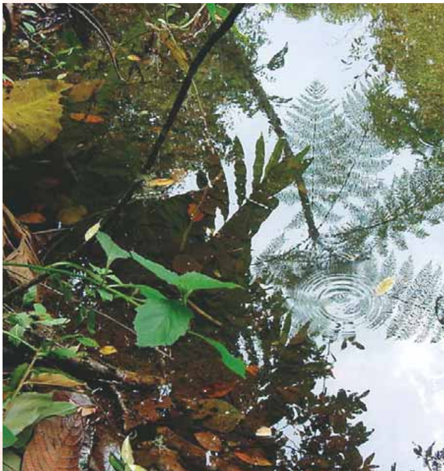
Reserva ecológica Fedena