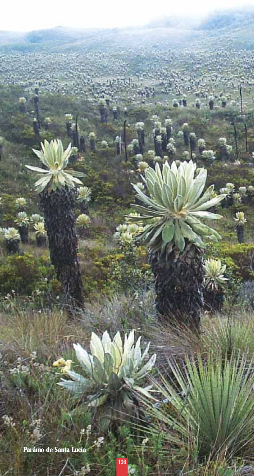
Parámo de Santa Lucía