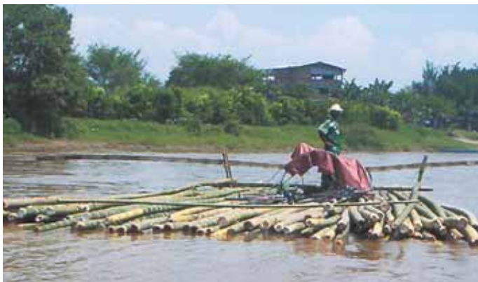
Río Cauca - El Hormiguero

Atractivos: El folklor y recorridos en lanchas de areneros por el río Cauca.