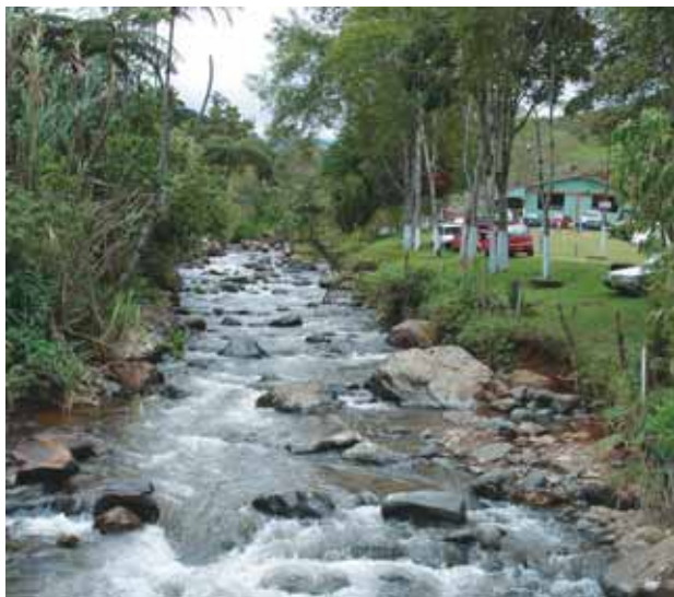
Río San Juan - El Queremal