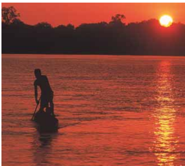
Río San Juan