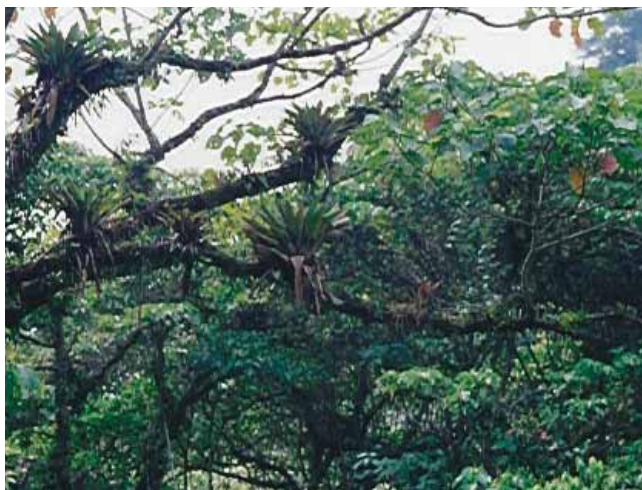
Parque Natural Nacional Los Farallones - Sector Corea