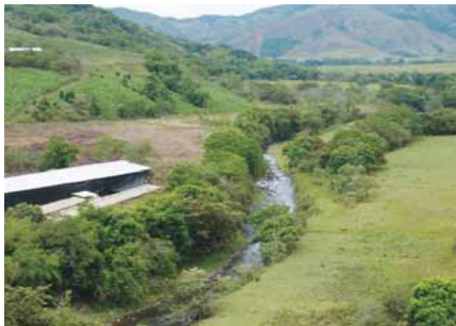
Río Portugal - Riofrío